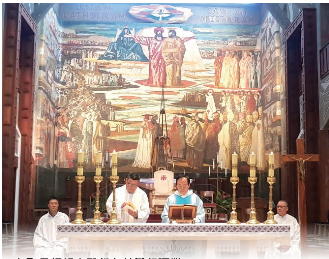
▲在聖母領報大殿祭台前舉行彌撒