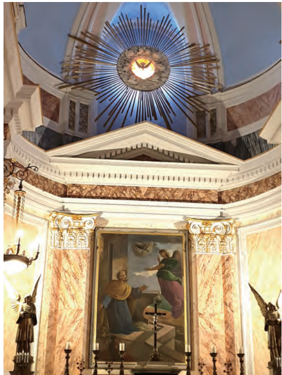
▲伯多祿開始向外邦人傳教的約培教堂