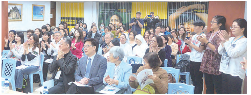
▲▼來自全國各地的天主教會醫療院所以及慈善、長照機構的第一線靈性關懷服務人員，踴躍與會，積極提問。