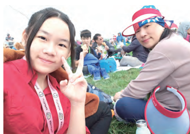
▼母女一起開心參與教宗的戶外彌撒