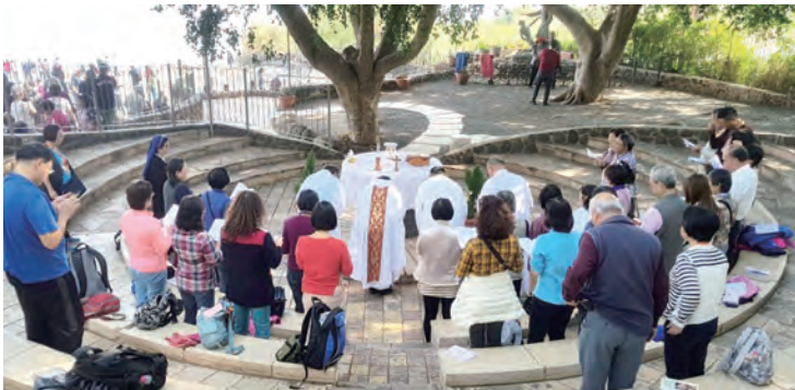
▲在元首堂外舉行露天彌撒