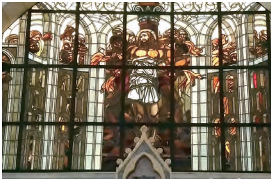
▲耶穌受審堂是苦路的起點