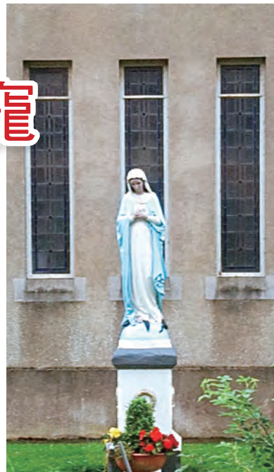
▲聖高隆邦總會院院中的美麗聖母

我們深深期盼台灣能清楚明白家庭所帶來的社會與文化價值，從歷史窺探無法以科技取代親情的地位，更了解家庭無法拋棄，必要延續生命的彌足珍貴。在寬恕這紛亂的世代衝突、打擊家庭價值的同時，我們必須不斷地祈禱：唯有家庭（教會）能呵護彌補我們的創傷，唯有家庭（教會）之愛才能實現耶穌基督的犧牲，滿全天主的計畫。