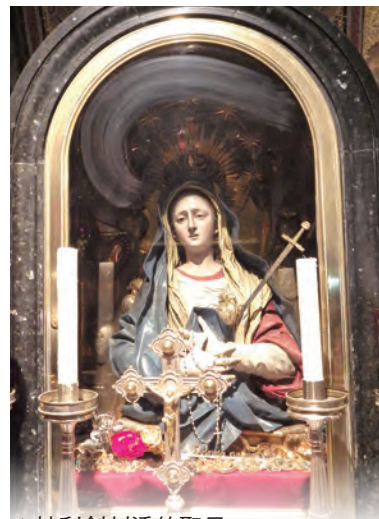
▲被利劍刺透的聖母