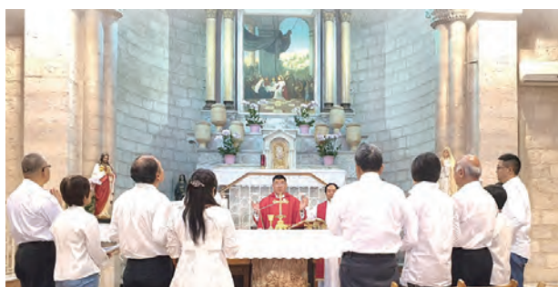
▲五對佳偶在加納重發婚願

誤匆匆進入大殿，沒想到竟被領到聖殿最前方的大祭台前舉行彌撒。面對大殿偌大的壁畫和祭台，深深感動，這是天主降生為人的起點，是一切救恩實現的開端，我們是何等有福，這朝聖的第一台彌撒竟能在此舉行，領受天主對全宇宙的愛澆灌在我們身上！