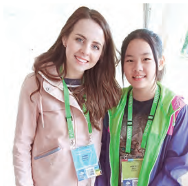
▲芮語和來自世界各地的青年相見歡