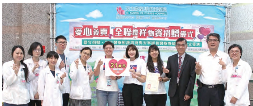
▲全聯慶祥基金會致贈物資盼協助需要患者度過難關們。

聖馬爾定醫院附設護理之家因應母親節的到來，特結合天主教崇仁醫護管理專科學校於5月8日下午在7樓活動區，透過數十位學生巧手為長輩們變裝打扮來歡度最美麗的母親節，期許護理之家長輩從中增加自我肯定也感受機構及學生的關愛，許多家屬也一起參與同樂，為大寶貝歡呼喝采！