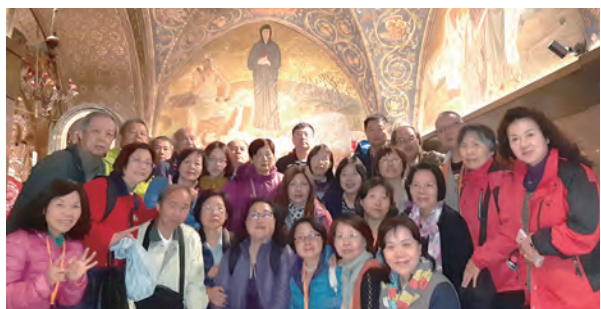
▲在痛苦聖母小堂舉行最後一台彌撒