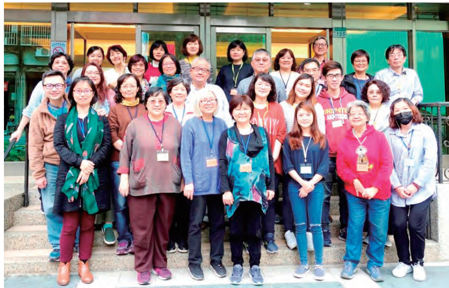
▲來自不同基督生活團的30餘位團員們，為慶祝2019世界基督生活團日拜訪深坑天主教福利會。

回顧起整個揪團日，大家都真實體驗了：當我們把自己有僅有的餅魚分享出來，我們就有機會分享彼此、划向深處，基督生活團真的是一個不分彼此、無比貼心、比家人更親的肢體。