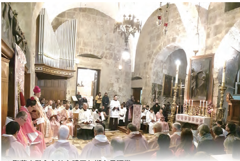
▲聖墓大殿內主教主禮四旬期主日彌撒