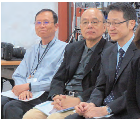
▲李克勉主教期許天主教會第一線靈性關懷服務者齊心努力，打造關懷城市。